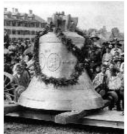
Glockenaufzug am 25. April 1912

Die neue Anlage steht im Kontrast zum bestehenden Kirchgemeindehaus, in dessen Untergeschoss fensterlose Zivilschutzräume vorherrschen. Dieses unwirtliche, beengende Ambiente zusammen mit der unzureichenden Isolierung gab denn auch den Anstoss für den Neubau. Denn eine Sanierung des bestehenden Gebäudes würde mit Kosten von gegen drei Millionen Franken keinen Mehrwert bringen. Dies überzeugte die Stimmberechtigten. AZ/AS ■