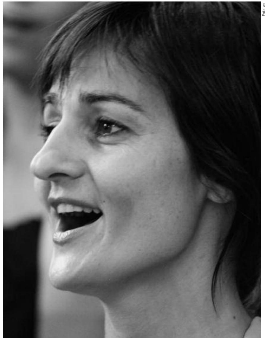
Singen von Herzen – Sängerin des Gospelchors «On The Move».