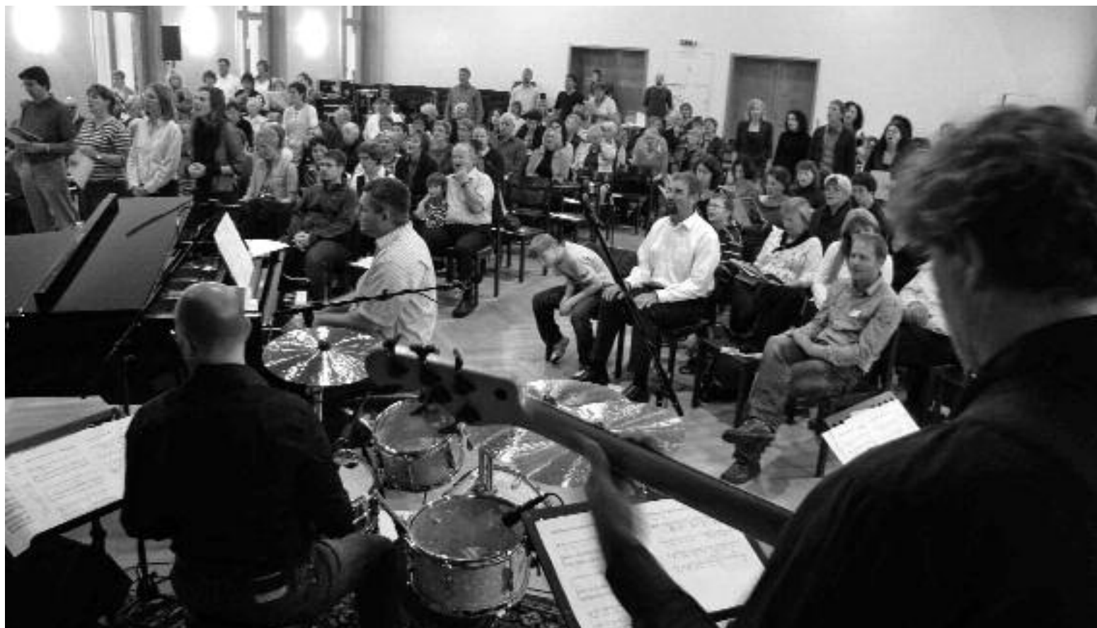
Mit Interessierten aus dem ganzen Kanton werden neue populäre Lieder einstudiert und gesungen: erster Kantonaler Singtag 2009.

lieder entsteht, der – auch über die Gemeindegrenzen hinaus – bekannt ist und gerne gesungen wird. Zum diesjährigen Kantonalen Singtag am 28. Oktober 2012 werden wir ein kleines Liederbuch präsentieren und an die Gemeinden verteilen lassen, das diesen Ansatz weiter in den Gemeinden verankern soll: Gott sei Dank – die St.Galler Singtaglieder 2009–2012 entfalten dann ihren grössten Wert, wenn sie uns «nachlaufen» und in den Alltag hinein begleiten. INTERVIEW: AS ■