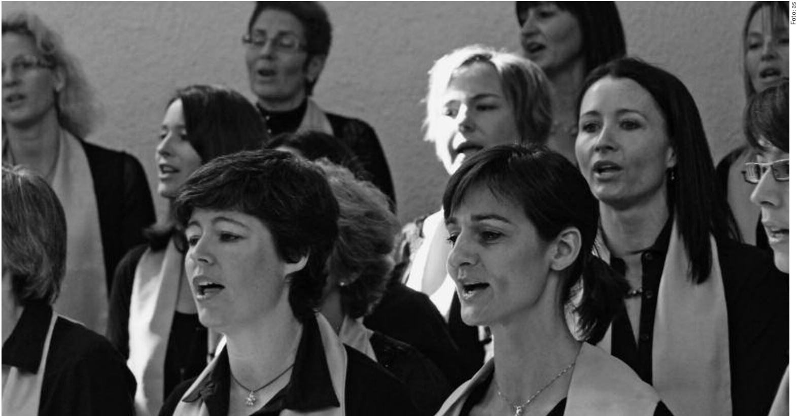
Sängerinnen des Gospel- und Popchors «On The Move» bei einem Auftritt in der Zwinglikirche Sargans.