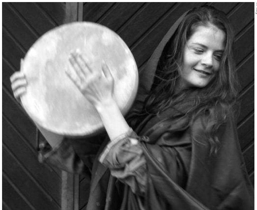
Prophetin Mirjam besang mit ihrer Handpauke den gelungenen Auszug aus Ägypten und führte den Freudentzug der Frauen an.

Über den Wert und die Bedeutung dieser Art Prophetie waren sich die Autoren der Bibel nicht immer einig. Während Moses, Aaron und Mirjam einmal in einem Satz als jene erwähnt werden, die das Volk Israel in die Freiheit geleitet haben (Micha 6, 4), findet sich andernorts (4. Mose, 12) eine klare Zurücksetzung Mirjams und Aarons. Gegen Ende der Wüstenwanderung hätten Mirjam und Aaron den Führungsanspruch von Moses infrage gestellt. Sie meinten, Gott habe nicht nur mit Moses, sondern auch mit ihnen geredet. Gott selber spricht dann das Urteil, dass er mit gewöhnlichen Propheten in Visionen und Träumen rede, aber mit Moses von Mund zu Mund, nicht in Gesichten und Rätseln. Für das Aufbegehren wird Mirjam von Gott während sieben Tagen mit Aussatz bestraft. AS ■